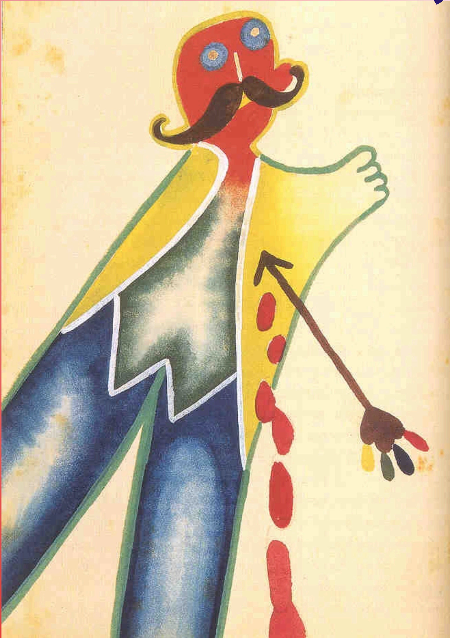
Desenho de Pedro Nava em Macunaíma, 1929. Guache s. Papel. 12x17cm